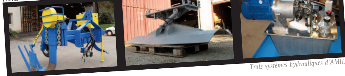
Trois systèmes hydrauliques d'AMH.