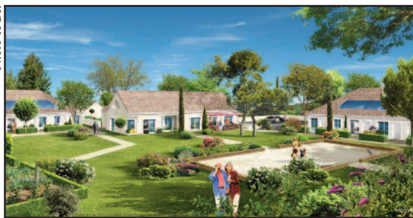
Un des projets de Sairenor