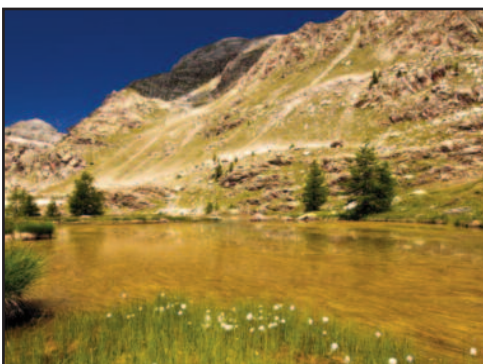
Le Parc national du Mercantour

tés, dont douze en nom propre, d'ici à la fin de l'année. Le rythme d'ouverture de cinq établissements par an est maintenu. De nouveaux sites sont d'ores et déjà programmés pour 2012, notamment au Mans et à Clermont-Ferrand. L'effectif est actuellement de 300 personnes dans les restaurants où le recrutement reste difficile. Le CA cumulé s'établit autour de 16,5 M€. BS