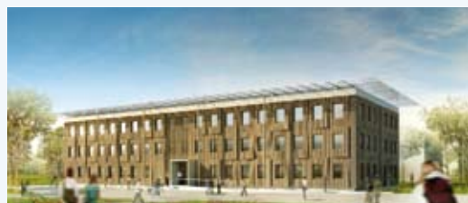
L'Alpha, premier-né de la gamme Ecospace.

■ Promoteur de parcs d'activités tertiaires et instigateur du concept Miniparc implanté dans une quinzaine de villes de France, Urbiparc (Echirolles) est devenue filiale à 100 % de Bougues Immobilier qui poursuit sa croissance externe dans la région. Urbiparc a été remarquée pour ses opérations basées sur la haute qualité environnementale et la basse consommation. Exemple : les Reflets du Drac, à Grenoble. L'arrivée de Bougues Immobilier va permettre la prise en charge de projets techniques nécessitant de gros investissements.